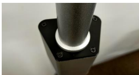
ビス止めをした状態