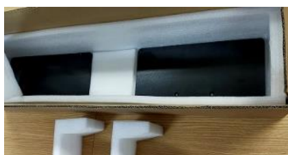
台座※箱の底に入っています。