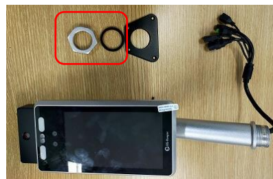
カバーを取り外した状態