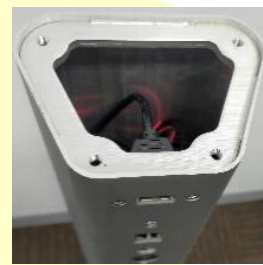
ビスを取り外した状態