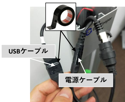
ビニールテープで止めた状態