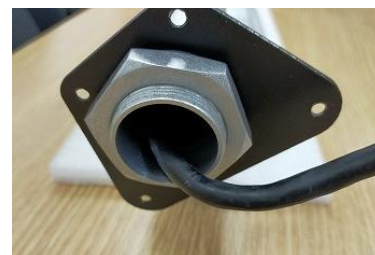
画面に対して少し斜めの状態