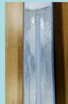
表面が腐食したスタンド例