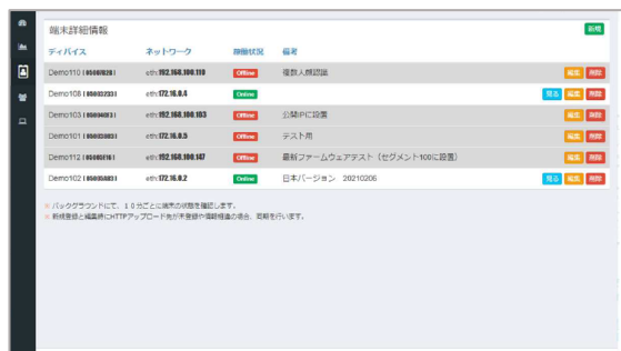
端末管理イメージ画面