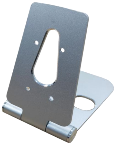
折畳み式スタンドスペック表